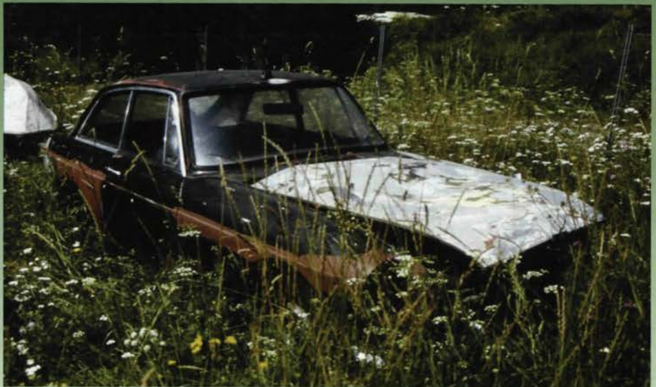
Roest: de stille knager aan uw mooie MGB.