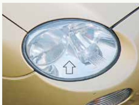
Reflector in de koplamp van een MGF kan dof worden