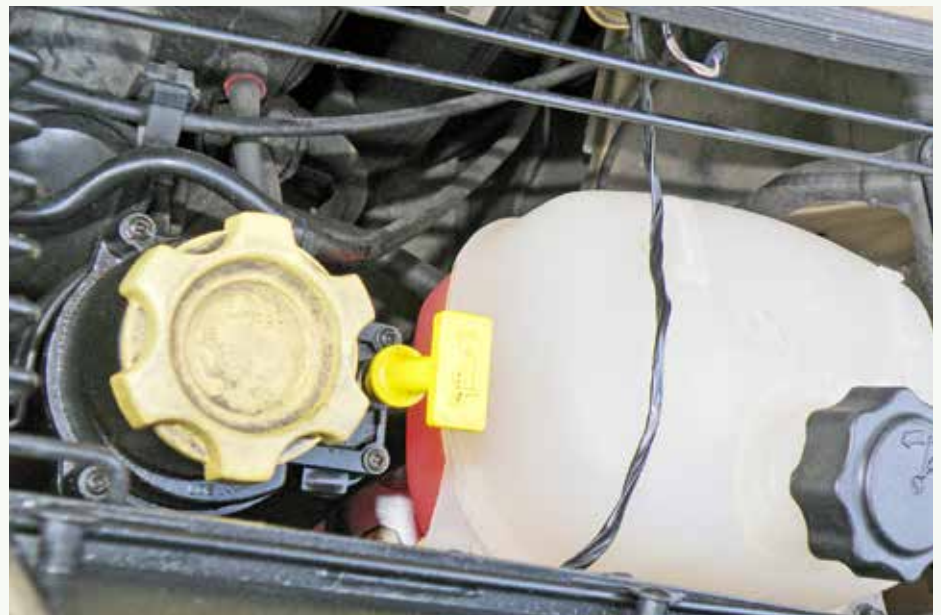
Eerste check: koelvloeistof en olie, beide op peil en schoon

Let wel: ik laat hierna zaken buiten beschouwing die bij de aankoop van elke gebruikte auto min of meer standaard zijn. Voorbeelden: onderhoudshistorie (!), spelingen in ophanging en besturing, banden (profiel, asymmetrische slijtage), toestand carrosserie (krassen, deukjes,