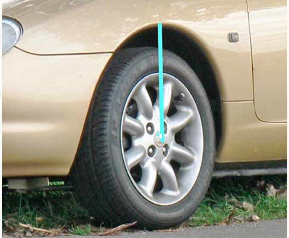
Meet veringhoogte MGF, 36,5 cm is oké

De MGF heeft zogenaamde hydragasvering, voor details lees het artikel "MGF veerbollen" in MG-Nieuws, november 2018. Check bij voorwielen de afstand van